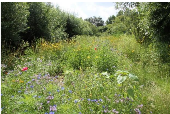
Unsere Bienenwiese im Schulgarten.